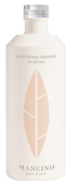
Mancino - Bio Huile d'olive vierge extra Art. 380825